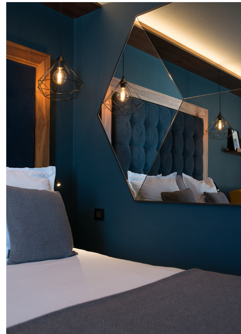
Ci-contre, dans une chambre, une tête de lit réalisée sur mesure, dans un alliage de bois massif et de velours.