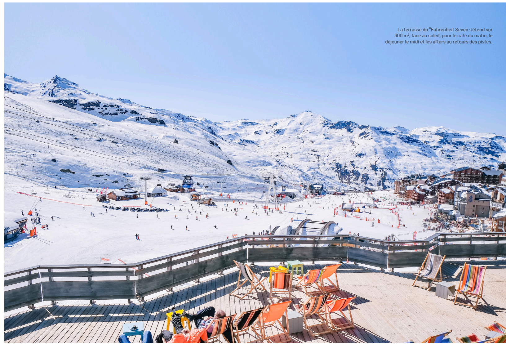
La terrasse du °Fahrenheit Seven s'étend sur 300 m², face au soleil, pour le café du matin, le déjeuner le midi et les after au retours des pistes.