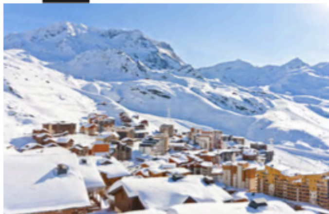
United Resort